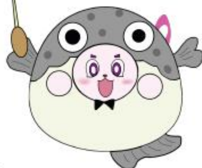
ふくふくびょうりいさん